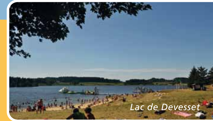
Lac de Devesset

Le Chambon-sur-Lignon liegt im Zentrum Frankreichs, am Rande der Cevennen und befindet sich ca. 900 m über dem Meeresspiegel, eingebettet in weitläufigen Wäldern und Wiesen der hügeligen, ursprünglichen Landschaft. Häuser aus Natursteinen und enge Gassen im Ort prägen den südlichen Charakter der Stadt, genauso wie das generationenübergreifende Boulespiel auf dem Marktplatz.